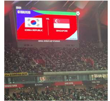
Texte de Jun et Youssik