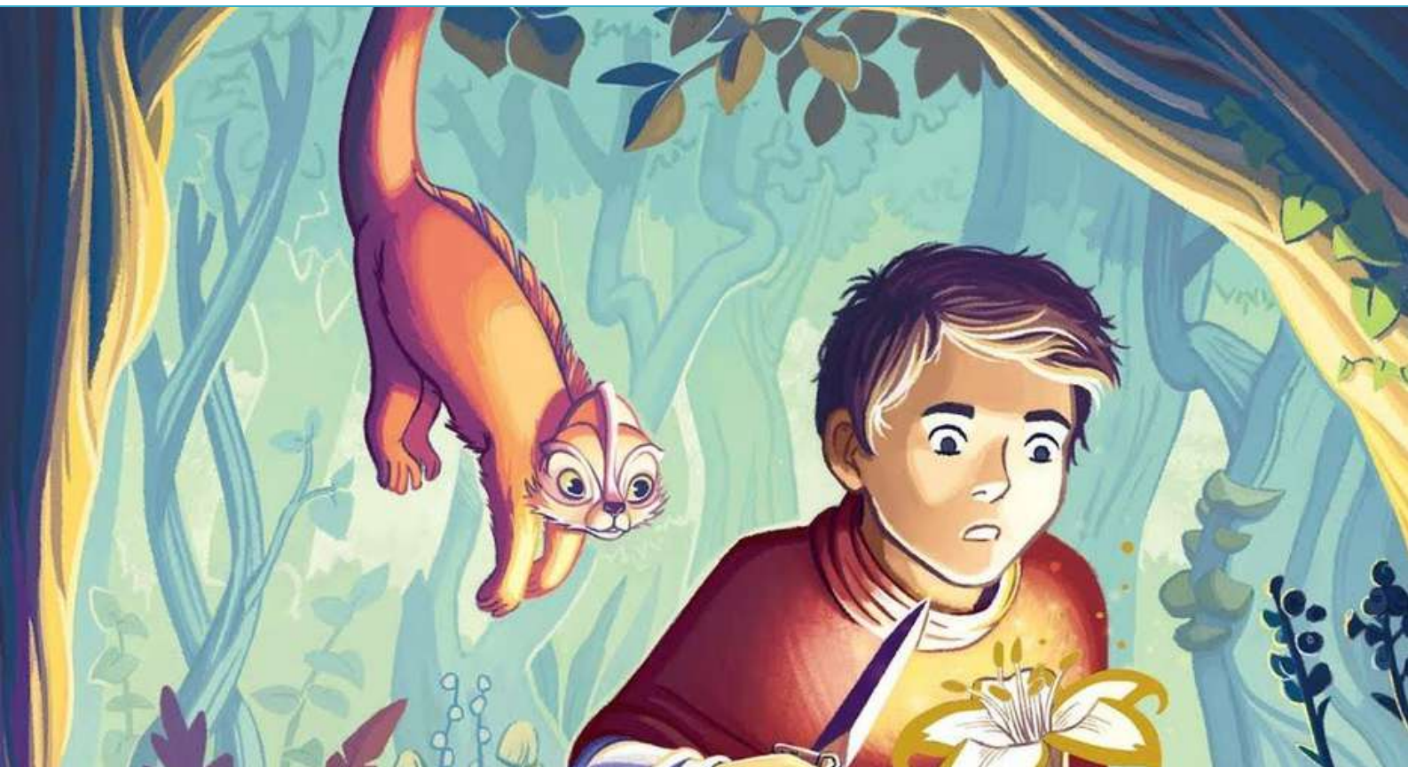
Dessin: couverture de "L'herboriste de Hoteforais"

LE PREMIER PRIX LITTÉRAIRE DÉCERNÉ PAR LES JEUNES LECTEURS